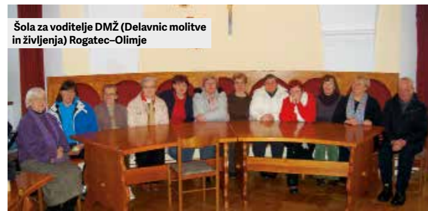
Šola za voditelje DMŽ (Delavnic molitve in življenja) Rogatec–Olimlje