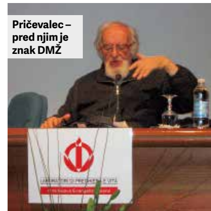
Pričevalec – pred njim je znak DMŽ

V letih bogoslovnega študija je precej časa posvečal branju zahtevnih del pisateljev, ki so ga duhovno dvigala in bogatila. Začutil je željo po mističnem izkustvu Boga. »V tistih dneh se mi je razkrilo spoznanje, ki me spremlja vse življenje: eno je beseda Bog, drugo je Bog sam.« Mašniško posvečenje je prejel leta 1952 v Pamploni. Nekaj let je deloval v domovini, leta 1959 pa je odšel v Čile in se z vsem ognjem vrgel na delo kot pridigar, pisatelj, organizator