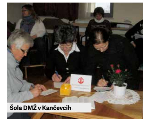
Šola DMŽ v Kančevcih